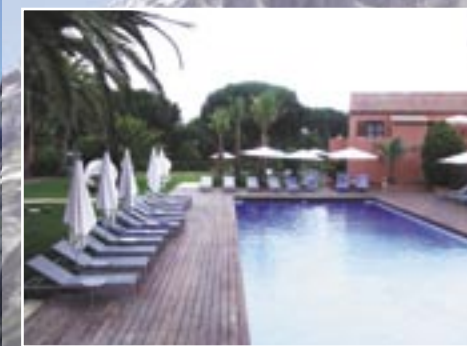
Saint Tropez – French Riviera: Benkirai Hotel