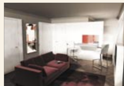
Interior: Residence Richer & Cecil Hotel more inside ►