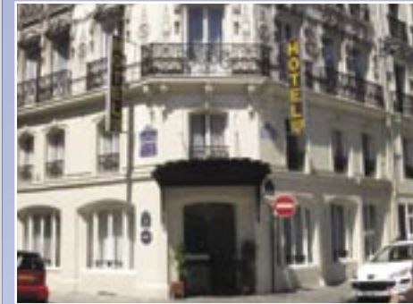
باريس: فندق سيسيل