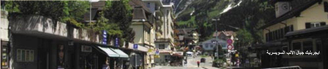
ايجربليك جبال الألب السويسرية