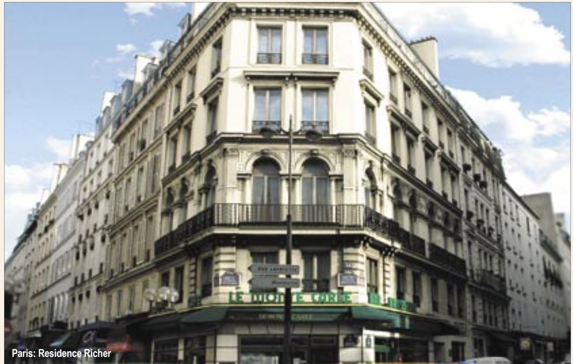
Paris: Residence Richer