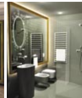
Below: Interior - Residence Richer