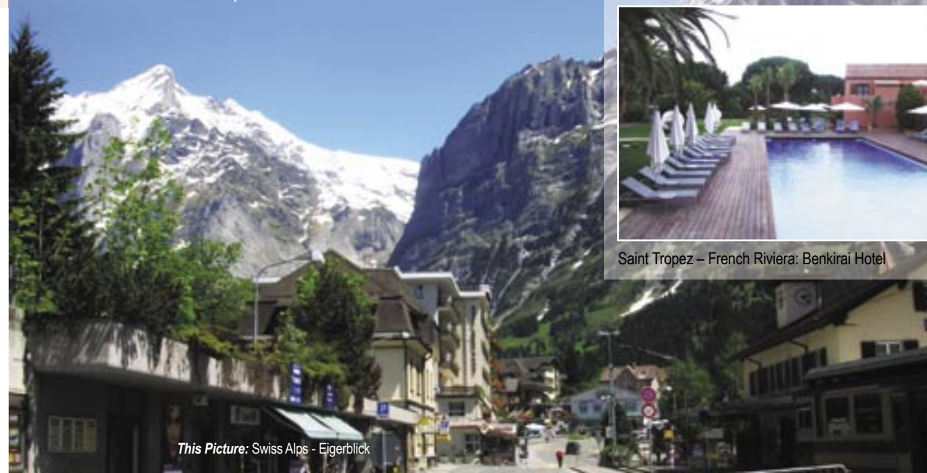
This Picture: Swiss Alps - Eigerblick