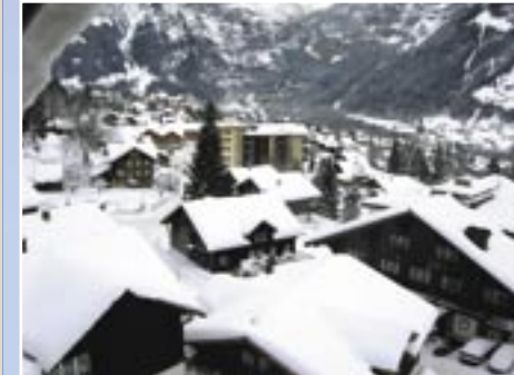
شارم أند مور فندق ايجربليك و ايجربليك ريزيدانس، جبال الألب السويسرية