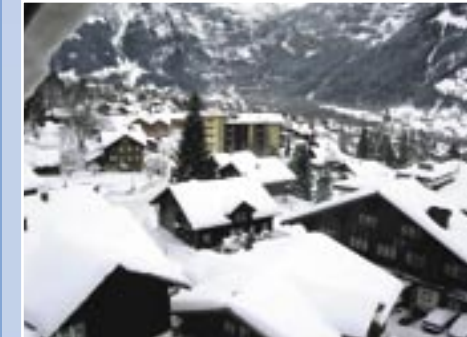
Swiss Alps: Eigerblick Hotel & Eigerblick Residence in full view