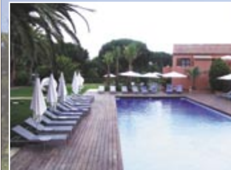
الرفيرا الفرنسية سانت ترويز: فندق بنكرياي