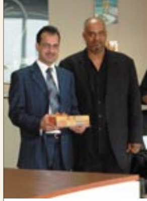
تكريم مسئول التسويق في المطار