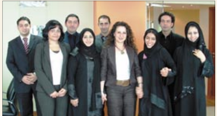
Best Closing Team 2005