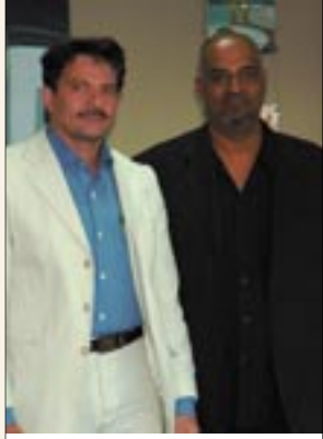
أفضل مندوب تسويق لعام ٢٠٠٥