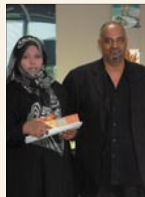
Top Telemarketing 2005