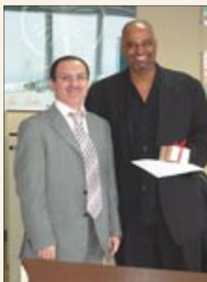
Top Team Manager 2005