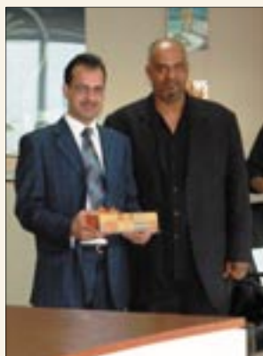
Awarding the Airport Supervisor