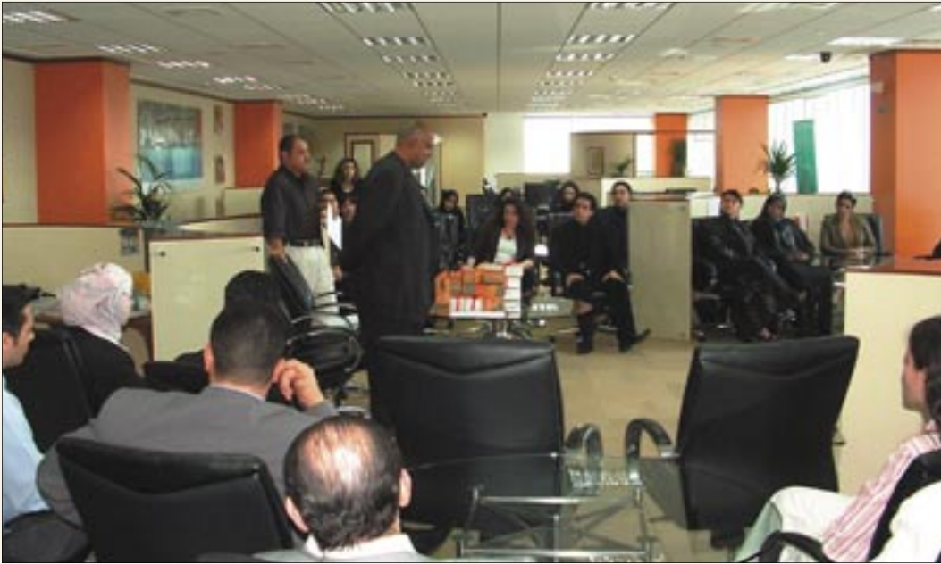
حفل توزيع الجوائز

ما كانت لتتحقق بدون التعاون المشترك والإيمان بروح الفريق والتنافس الشريف بين أفراد الفريق لتحقيق أفضل النتائج كما شدد على أن الموقف الذي يأخذه الفرد هو ما يحدد طبيعة العلاقة بين الموظفين والعملاء ويشكل الفرق بين العمل الجيد من غيره والذي ينعكس عليه إنتاج الفريق والفرد وهو ما تسعى إليه الصقر العربي للعطلات من تفوق رفيع المستوى لخدمة العملاء.