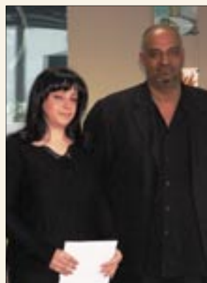
Top Sales Rep. 2005