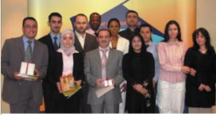
فريق المبيعات الفانز لعام ٢٠٠٥