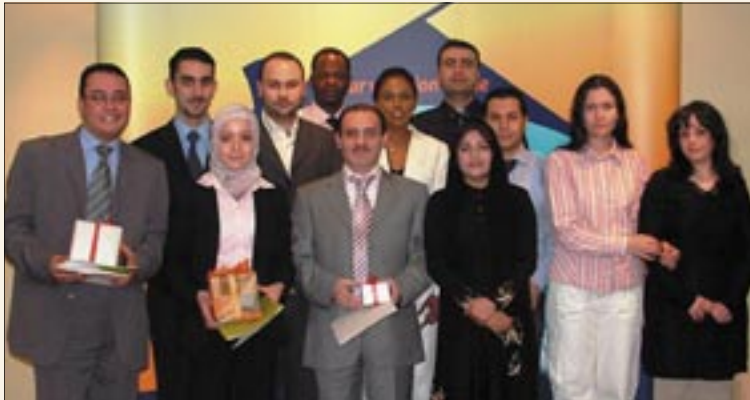
Winning Sales Team 2005