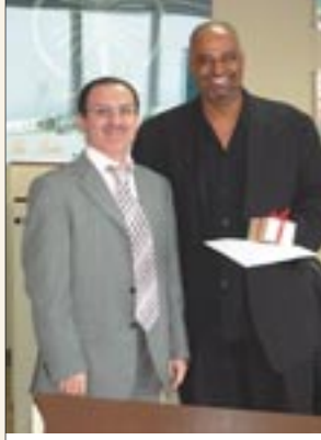
أفضل رئيس فريق مبيعات