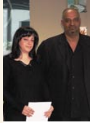
أفضل مندوبة مبيعات لعام ٢٠٠٥