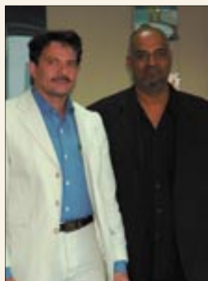
Top Marketing Rep. 2005