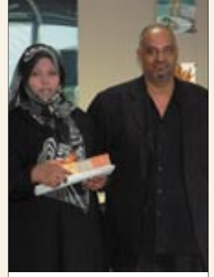
أفضل مندوبة تسويق على الهاتف ٢٠٠٥