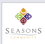
Launch of the Seasons Community.