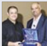
Arabian Falcon Awards 2006