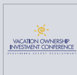
AFH platinum sponsor of conference.