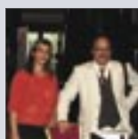
American Institute of Implant Dentistry Conference