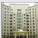
News about the Royal Club at the Palm Jumeirah.