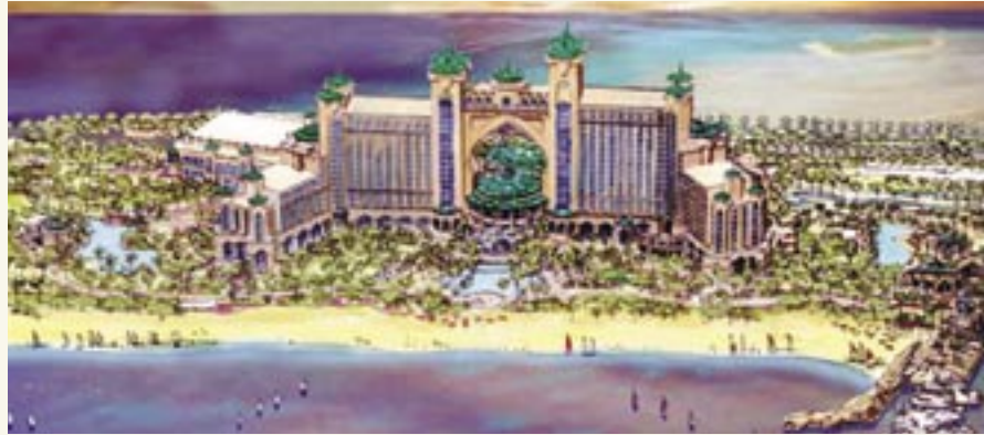
The first phase of Atlantis will include a 1,000-room hotel With annual tourist arrivals projected at seven million by the end of the decade, opening the project will be toward the end of 2007.

'Atlantis, The Palm' will also include a larger version of the water and marine theme park in Paradise Island, in the Bahamas, featuring killer whale and dolphin shows, making Atlantis the biggest in the G.C.C. area.