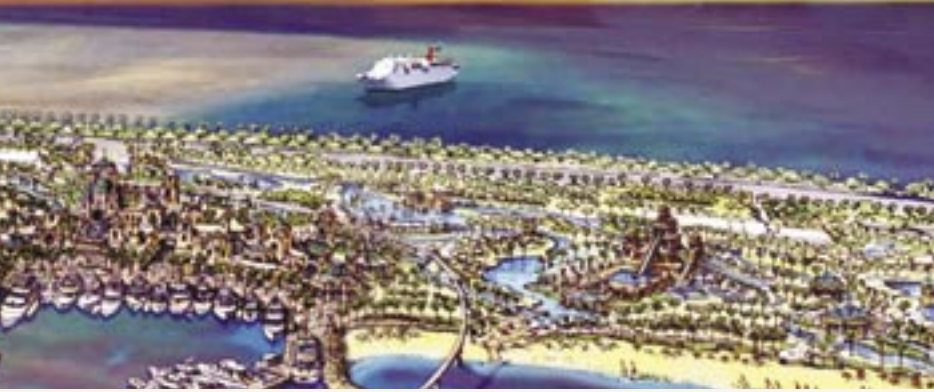
المشروع هو شراكة ٥٠/٥٠٪ بين شركة نخيل وشركة كيرزنر أنترناشونال التي تدير فندق رويال ميراج بدبي وتمتلك سلسلة فنادق برايديس أيلاندس في جزر البهاما

أروع الجسور في العالم من خلال (١٠) مسارات (٥) منها في كل اتجاه حتى يصل إلى الجزيرة بفتق بعدها إلى جسرين فوق الجذع بخمس مسارات في كل اتجاه.